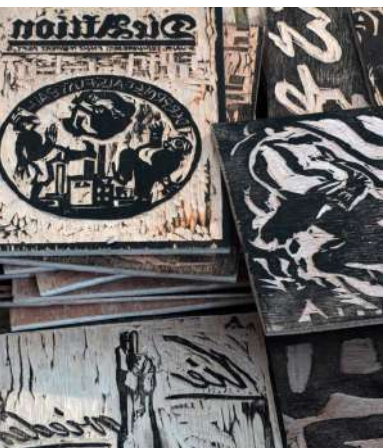
Création en cours.

Chaque année, dans le cadre d'une aide à la création, un artiste est invité par "l'âne hautain et la bélière sauvage" pour la création d'un livre d'artiste en résidence à Forcalquier quelques semaines avant le festival. Sa création et son travail sont mis en valeur lors du festival et de l'exposition des artistes qui se prolonge au musée jusqu'au 23 juin.