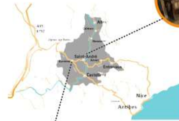
Musée de la minoterie la farine à La Mure-Argens